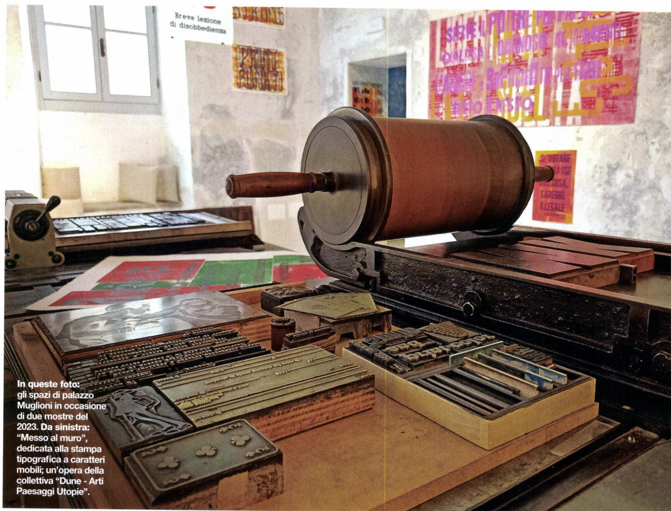
In queste foto: gli spazi di palazzo Muglioni in occasione di due mostre del 2023. Da sinistra: "Messo al muro", dedicata alla stampa tipografica a caratteri mobili; un'opera della collettiva "Dune - Arti Paesaggi Utopie".